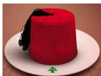
Roland du Liban